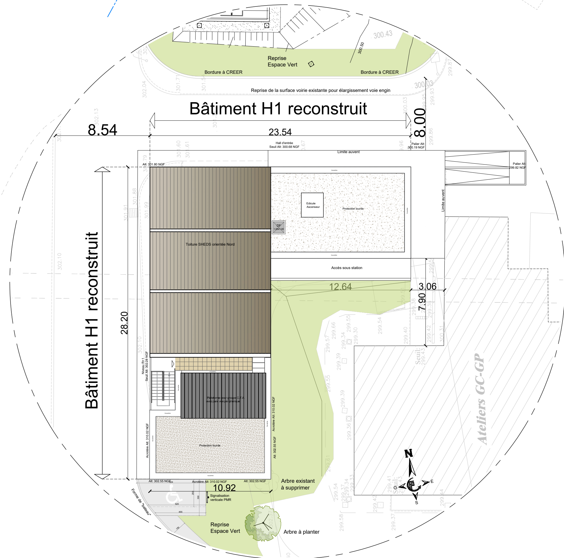
Détail - Plan de Masse Echelle : 1 / 200e